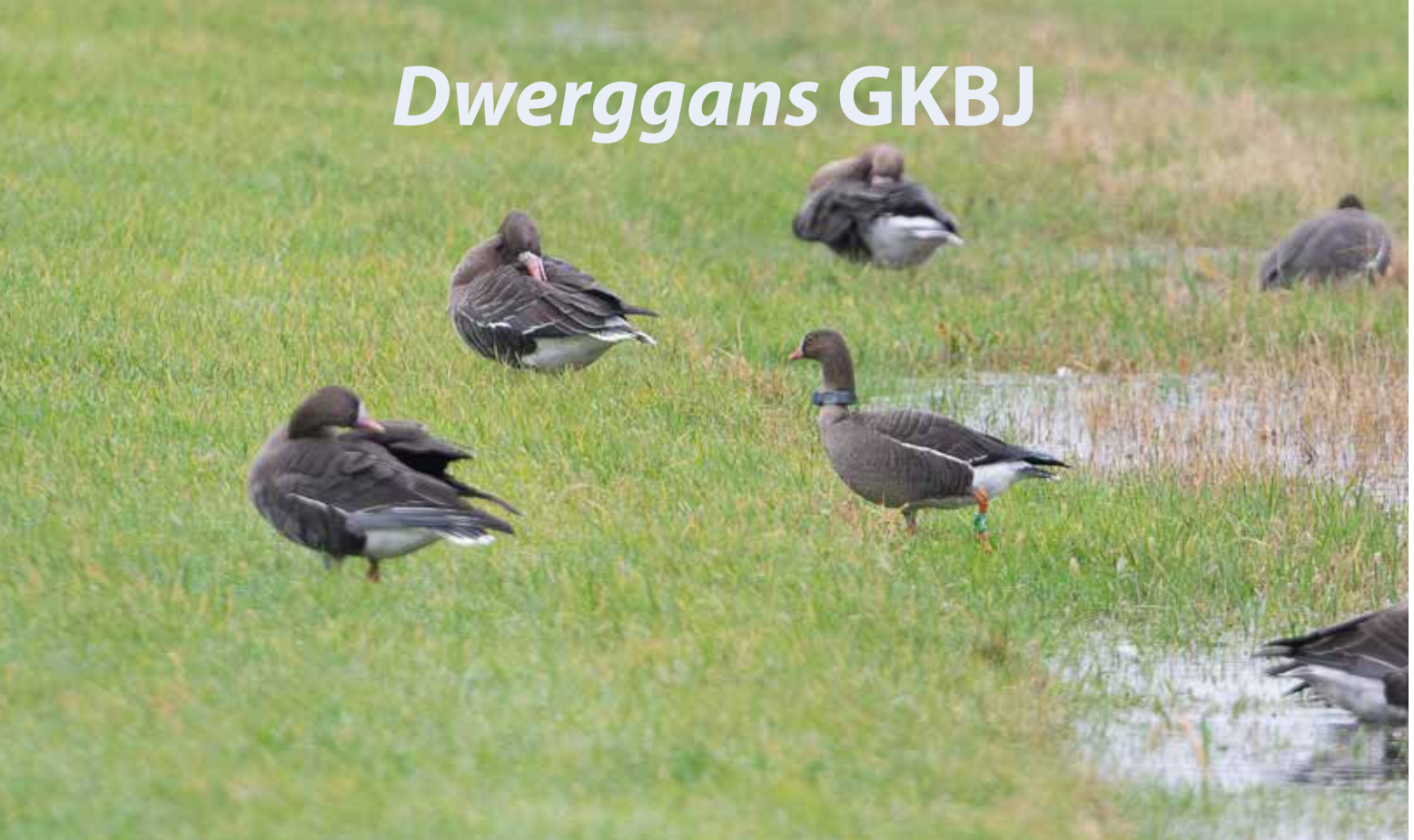
Dwerggans Groen K