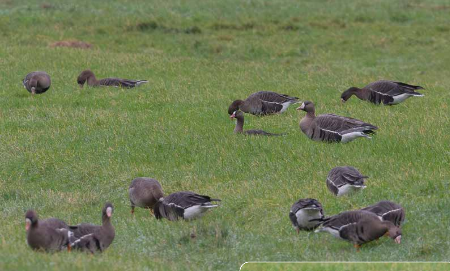
Dwerggans tussen de kolganzen Rechts dwerggans Blauw J

broedseizoen om zich te goed te doen aan bessen (vooral kraaiheid, Empetrum nigrum ). Later in augustus/september is de groep via verschillende plekken in Zweden op de vloeivelden in Eskilstuna beland, een bekende pleisterplaats voor dwergganzen.