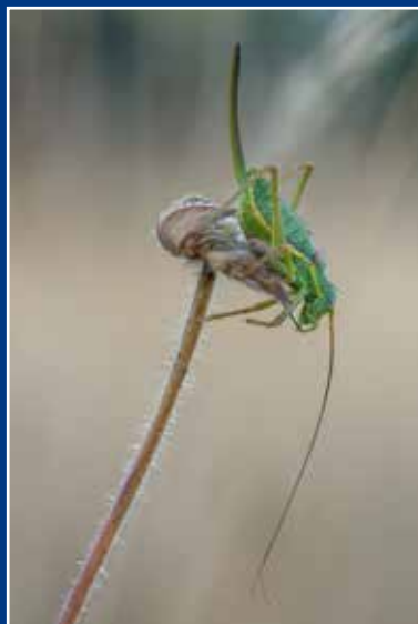
Coverfoto zadelsprinkhaan. (p.14-15)